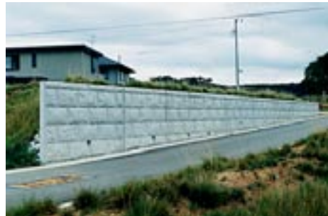
法止ブロックFL-A(デザイン)宅地用擁壁