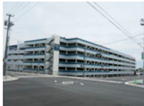
ららぽーと磐田・静岡