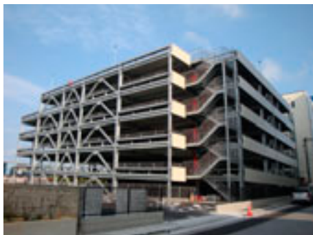
プロト宜野湾・沖縄